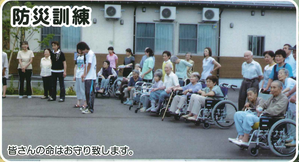
皆さんの命はお守り致します。