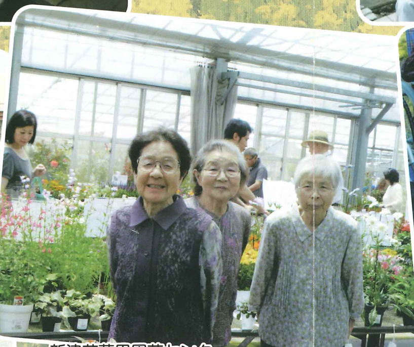
新津花夢里園芸センター きれいなお花をたくさん見ってきました。