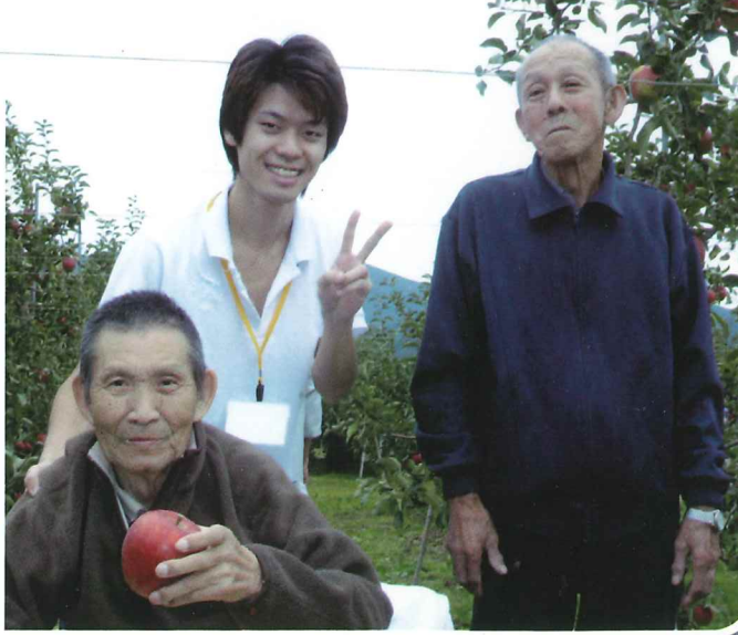
大きなりんごをゲット おばあちゃんにおみやげがで~きた。