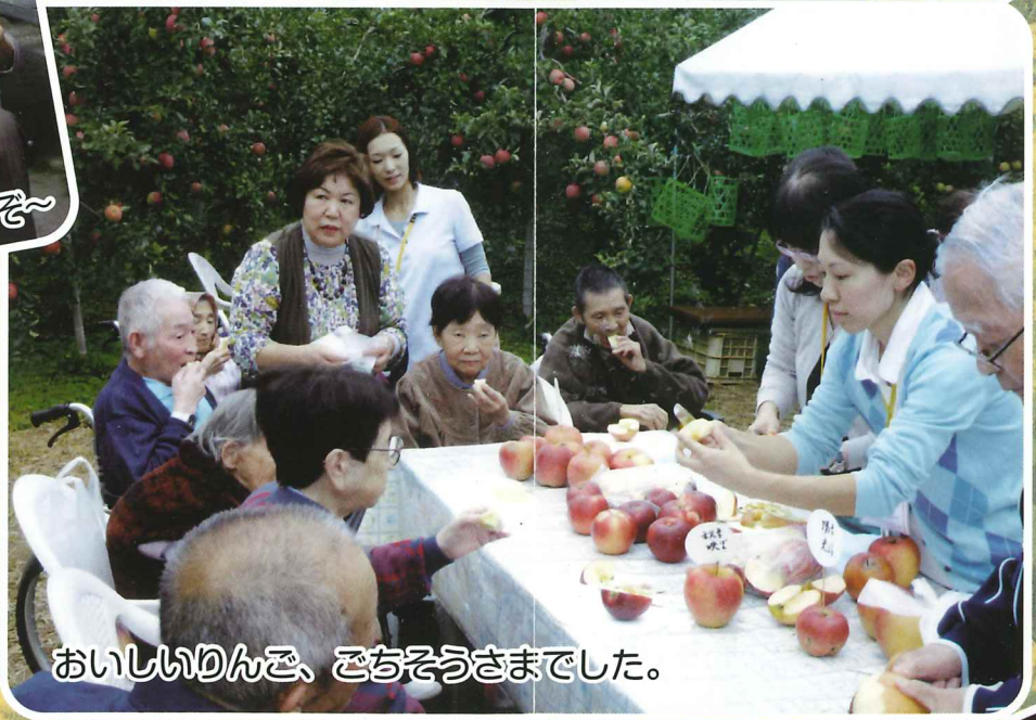
おいしいりんご、ごちそうさまでした。