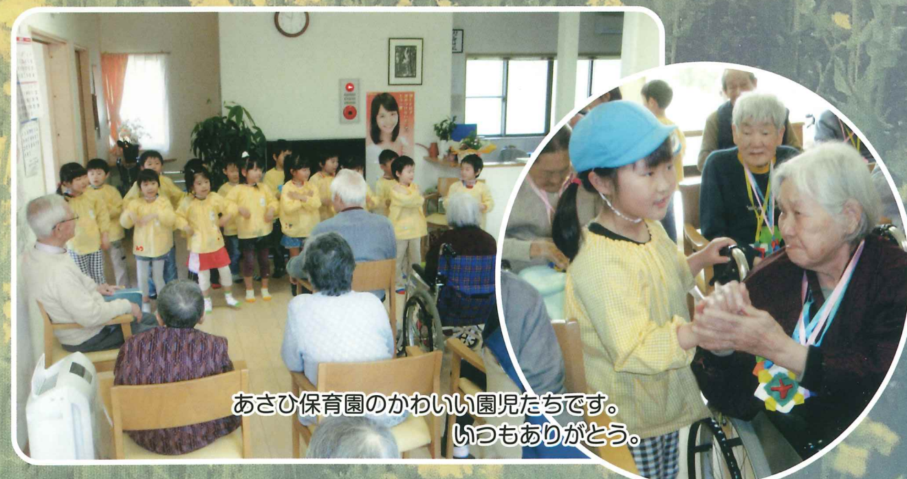
あさひ保育園のかわいい園児たちです。いつもありがとう。