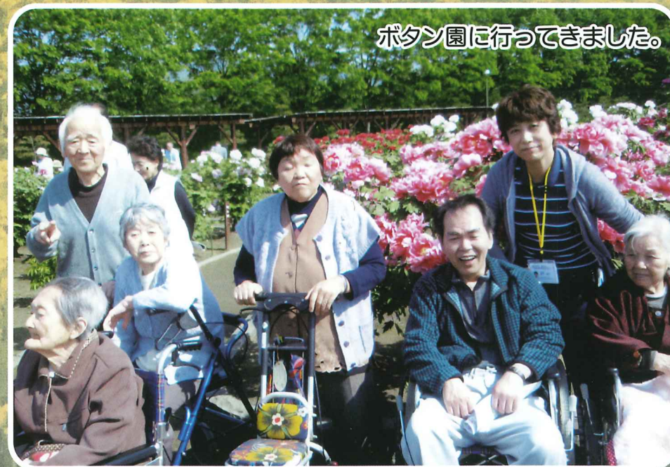
ボタン園に行ってきました。