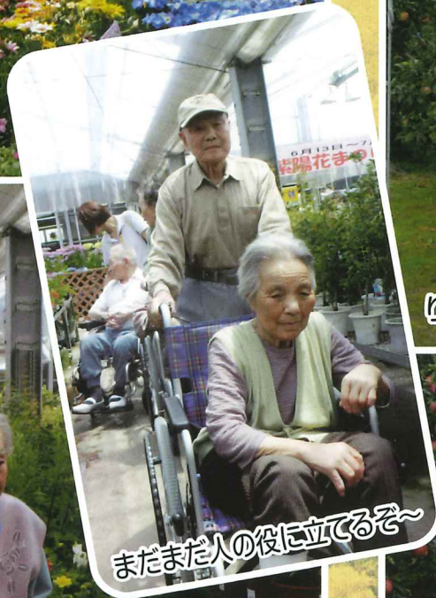
まだまだ人の役に立ってるぞ~