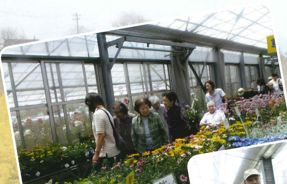
新津花夢里園芸センター

平成二十四年七月二十一日より、管理部長として入職しました。以前、私はリハビリを主とする仕事をしておりました。この度、小規模多機能型居宅介護及びグループホームなどの現場、仕事の中身などを見て、教わり、感じる中で私自身の視野の狭さ、経験の浅さというものを日々感じているところでもあります。 私が、三施設の管理部長を仰せつかり、責任を感じていると共に、なお一層、人を想う気持ちを大切にしていきたいと感じております。ご縁があり、当施設に務めさせて頂きましたので、これからは会社理念の基、ご利用者様、ご家族様の在宅での生活を少しでも支えることができるよう、又、今までの経験も生かしながら、ご利用者様と、回りを支えているご家族様が幸せになることができる施設を目指し、頑張っていく所存です。 今後も、皆様方のご理解とご支援を受けながら職員一丸となって取り組んでいきたいと思っておりますので、よろしくお願致します。