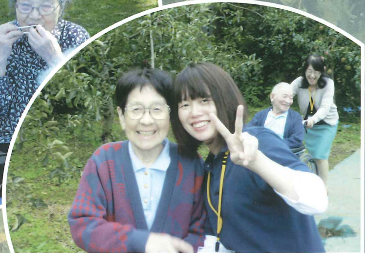
りんごも顔負け、ツーショット