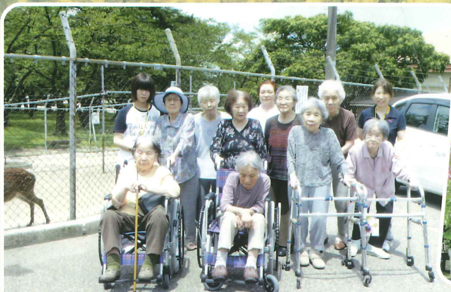
鹿さんより、ラーメンが美味しかったね。

みんなで参加できました。子供たちのお遊戯で涙、涙の連続でした。元気いっぱいいただき、ありがとうございました。又、来年も参加できるよう頑張ります。