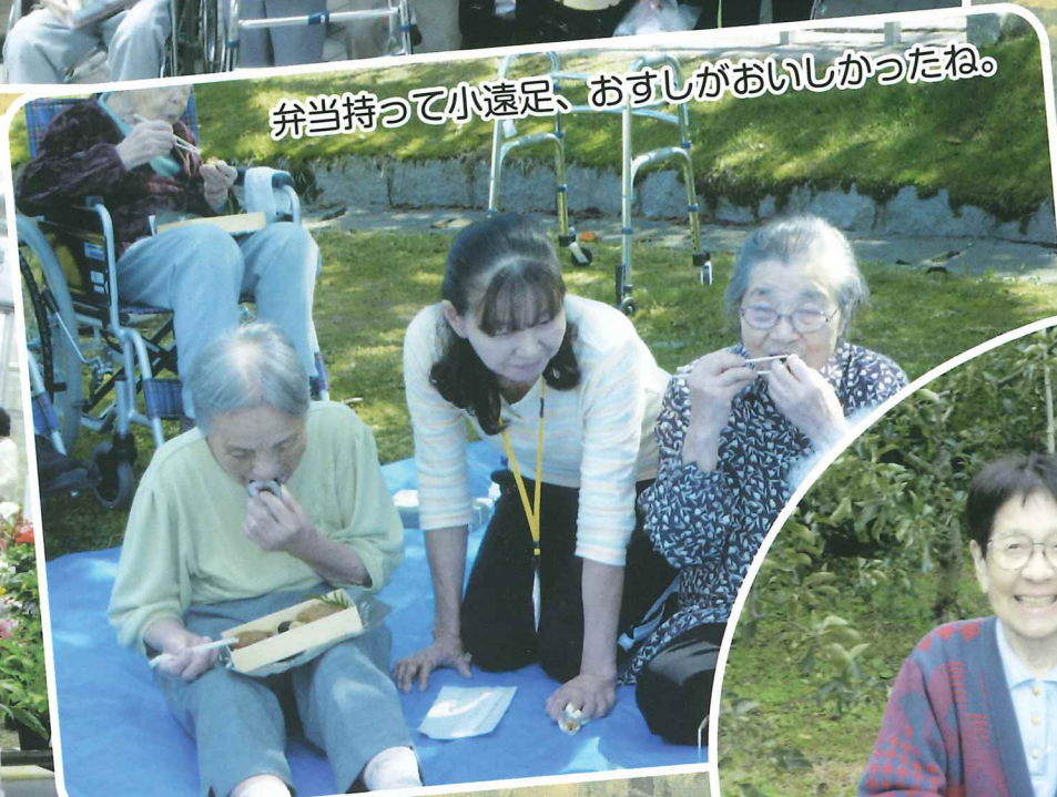
弁当持って小遠足、おすしがおいしかったね。