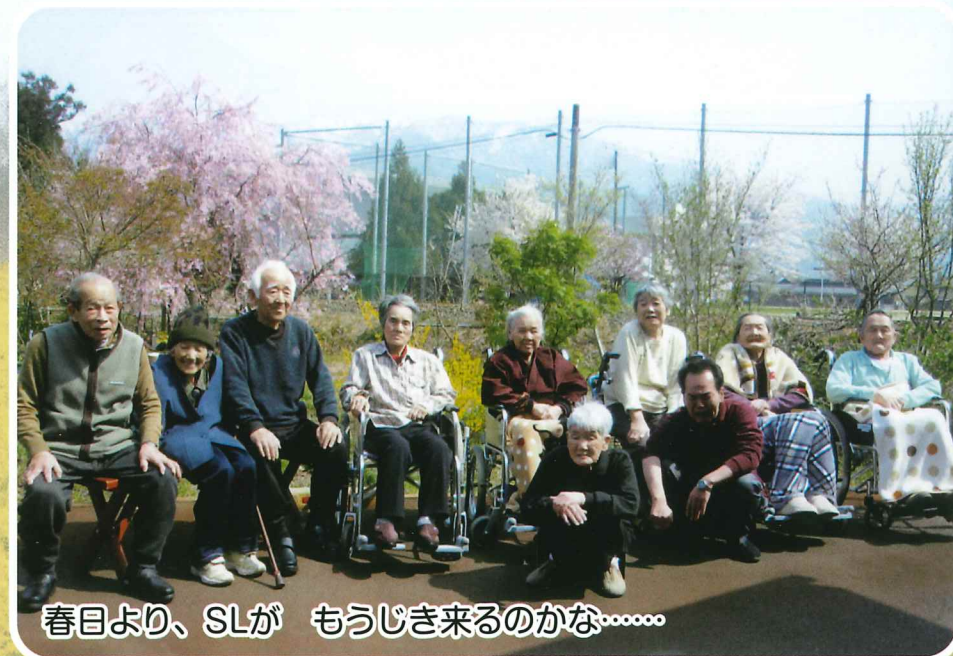
春目より、SLが もうじき来るのかな.....