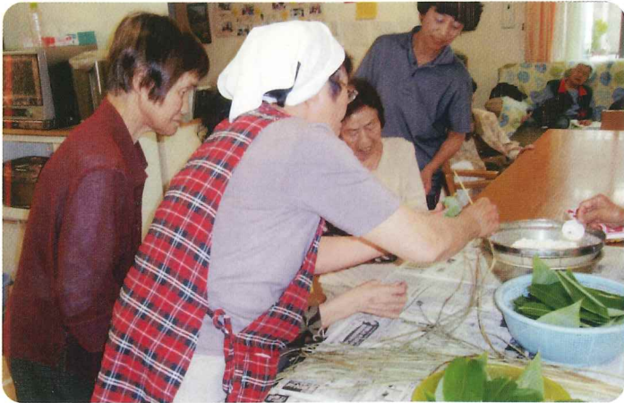
ちまき作りをしました