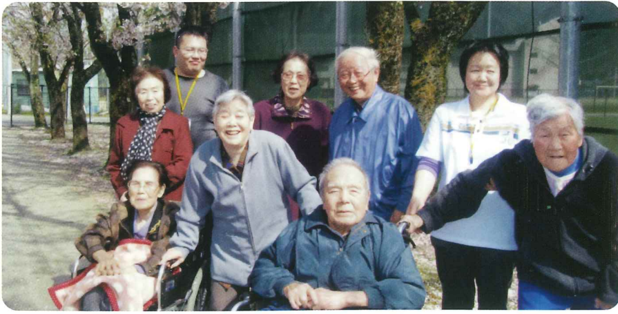
お花見に行ってきました