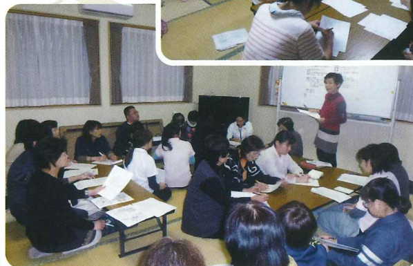
3事業所合同勉強会