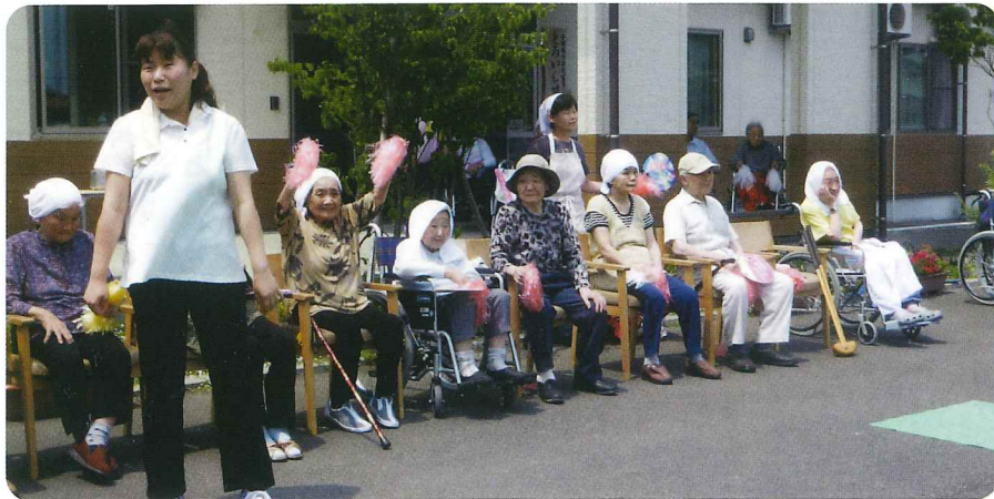
3事業所 ゲートボール大会

これからもお客様に安心して穏やかに笑顔で日々の生活を送れるよう援助し、菜の花へ来て良かったと思われるよう温かな介護で頑張りたいと思います。