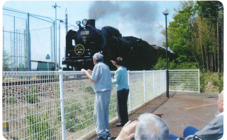
お天気の良い日はSLを迎えます