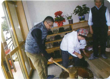
地域交流・家族交流 もちつき

ご利用者様一人ひとり、その人らしい生活ができるよう私たち職員が寄り添い共感し毎日のお手伝いを心がけています。ご利用者様が楽しくいろいろな行事などに参加していただけるよう、又、よりよい支援を提供できるように、職員が協力し、取り組んでいきたいと思っています。