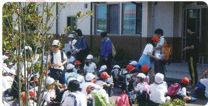
五泉南小学校 村松公園遠足の途中立ち寄りしました