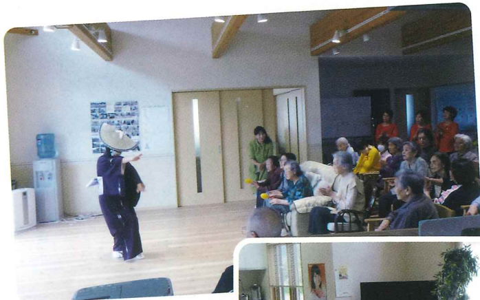
大正琴のボランティア おどりも披露して いただきました